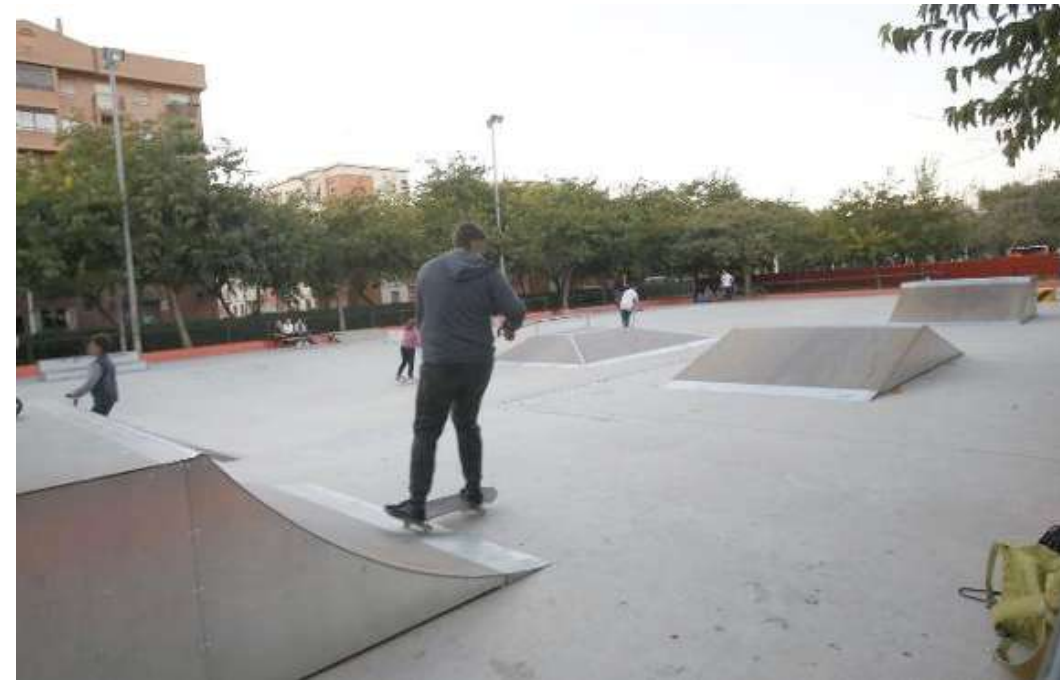
Skatepark de Tres Cruces

Skatepark modular situado en pista de patinaje pública municipal con elementos de estructura metálica y superficie en madera.